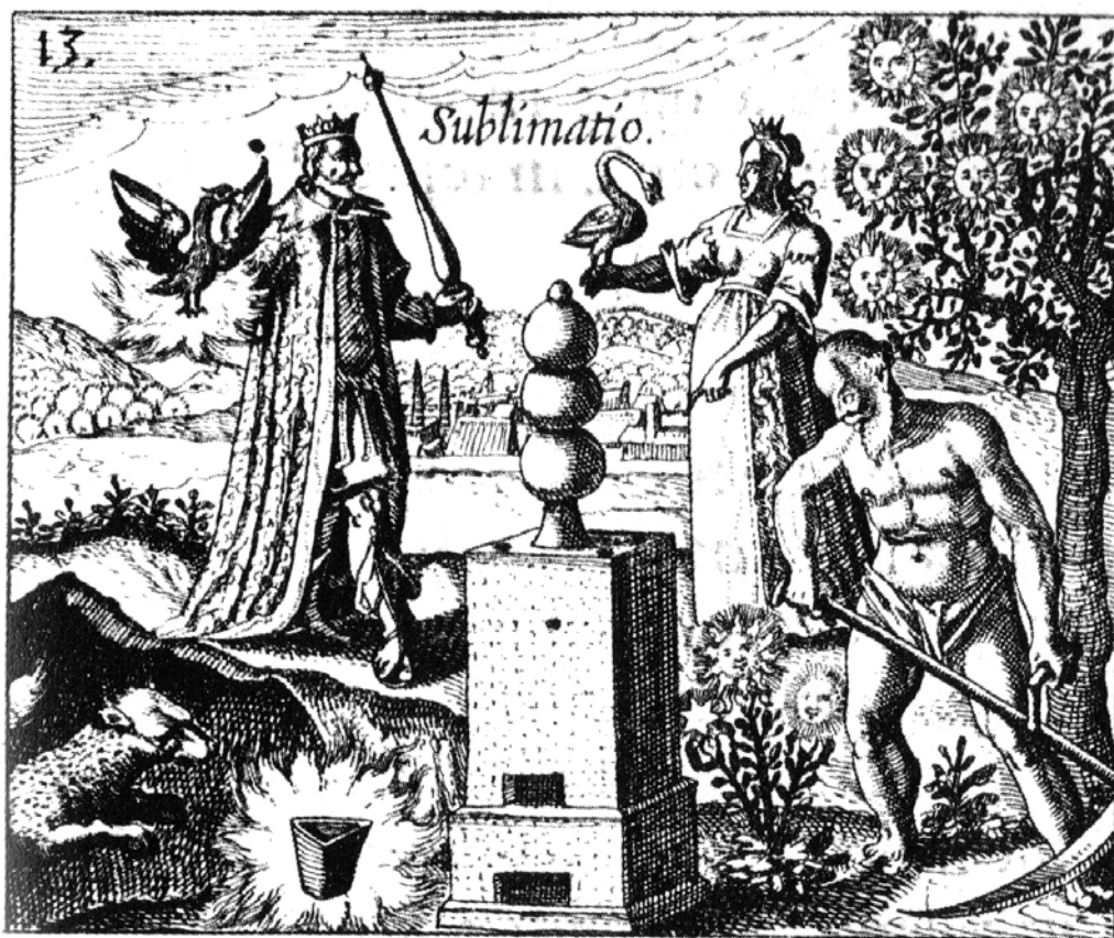
Johan Daniel Mylius, Sublimatio , gravure extraite du traité d'alchimie Phylosophia reformata , 1622

Contact presse Brunswick Arts : Maude Le Guennec / Andréa Azéma regionlrmp@brunswickgroup.com +33 1 53 96 83 83 / +33 6 29 18 48 12 Région : Sylvie Caumet, sylvie.caumet@regionlrmp.fr / +33 7 76 80 75 03